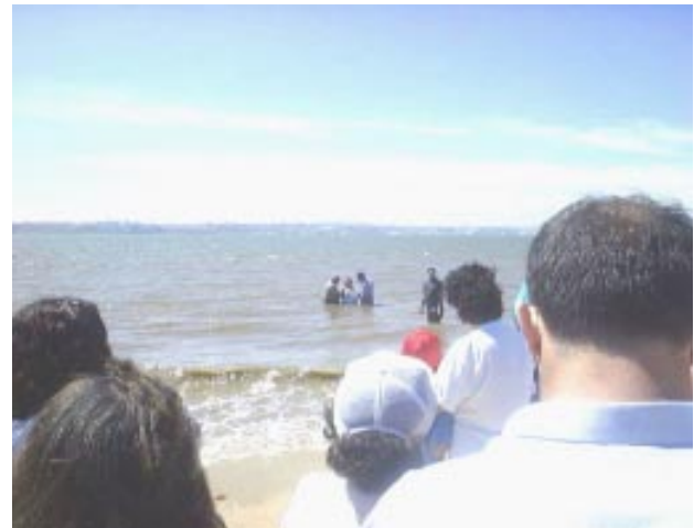
Vista parcial de una escena bautismal realizada en Lisboa, Portugal

En el año 2000 la IUJC y la CCP hicieron dos resoluciones importantes: Crear una alianza entre ambas, la cual será conocida como "Alianza de las Iglesias de Dios del Séptimo Día de Portugal". Solicitar su admisión ante el Congreso Ministerial Internacional basándose en los Estatutos de esa organización. Nuestro objetivo es promover cooperación entre las iglesias que se identifican con el sello de Dios (Apocalipsis 12:17; 14:12), unificando el esfuerzo de predicar a Cristo por todo el mundo usando la única forma de esparcir el verdadero Evangelio (el amor de Cristo y la fidelidad a los Mandamientos de Dios)".