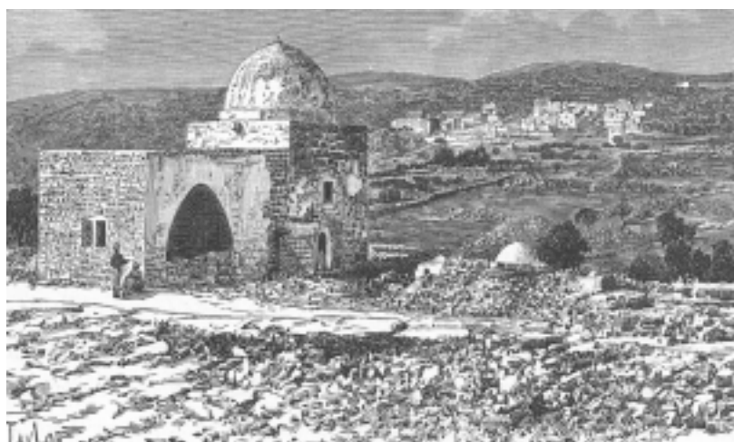
BOSQUEJO DE CÓMO PUDO HABER SIDO LA TUMBA DE RAQUEL

“Así murió Raquel, y fue sepultada en el camino de Éfrata, la cual es Belén. Levantó Jacob un pilar sobre su sepultura, y esta es la señal de la sepultura de Raquel hasta hoy.” Génesis 35:19-20.