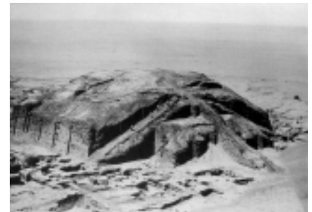
Vista aérea del gran Zigurat de Mesopotamia

Otro aspecto que falta por descubrir es si en verdad la torre fue diseñada para servir con propósitos religiosos, pues aunque el relato bíblico no lo menciona, sí menciona que los antiguos creían que adorar en lugares altos facilitaba estar más cerca de sus dioses. Incluso el Altísimo aceptaba esa idea. FIN.