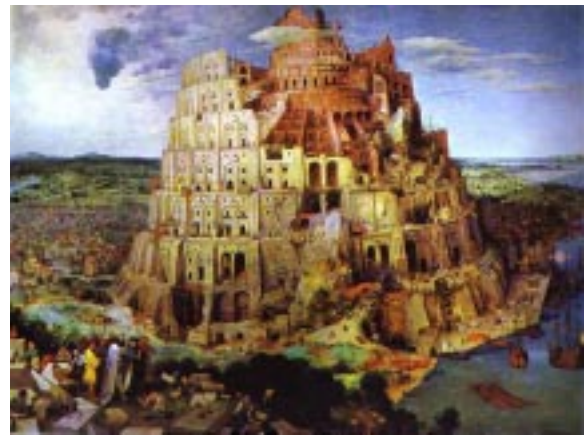
Representación artística de cómo pudo haber sido la más famosa torre de todos los tiempos

De esa torre aún no han sido encontrados registros escritos que detallen sus dimensiones y el nombre de sus constructores y el número de ellos. Lo cual significa esperar a que la Arqueología continúe su trabajo hasta encontrar la información descriptiva. El momento vendrá cuando obtengamos datos de ella.